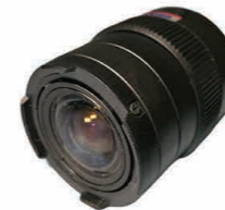
Objetivo Gran Angular Varifocal 4,0 – 12,0 mm