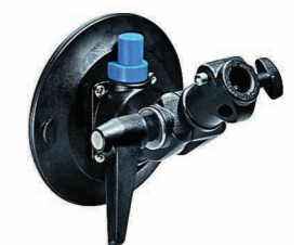
Ventosa de fijación para sistema TroublePad