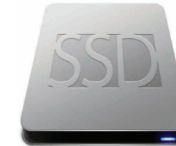
Opción tableta 512GB y 1TB