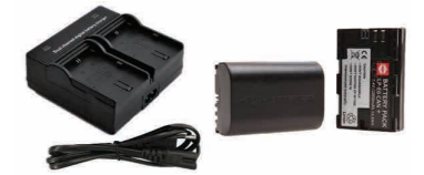
Kit de baterías para iluminación estación TroublePad