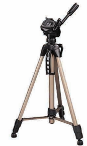
Trípode para estación TroublePad