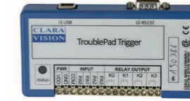
Dispositivo trigger +- 24V y hub USB3