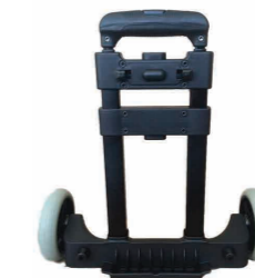
Carrito desmontable para maleta estación TroublePad