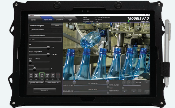
Interfaz simplificada para una intuitividad máxima