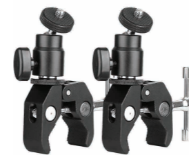
Abrazaderas para fijación rápida y sin problemas