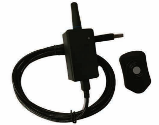
Disparador inalámbrico para estación TroublePad