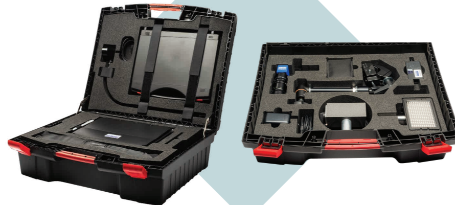
Estación TroublePad en su maleta de transporte