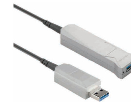
Cable híbrido de gran longitud (10, 20, 50 metros)