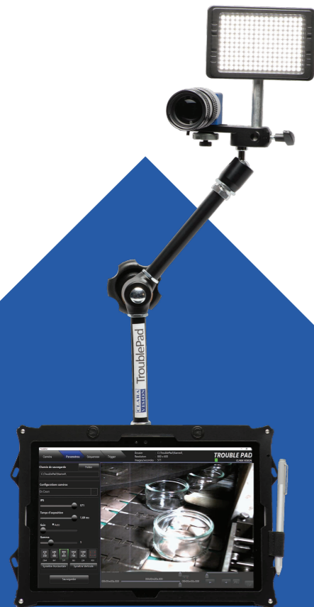
Cámara rápida TroublePad en su brazo de fijación y su software en tableta

TroublePad es un sistema ultraportátil de vídeo rápido. La cámara de alta velocidad TroublePad permitirá captar, diagnosticar y comprender los eventos furtivos o aleatorios que se producen en sus cadena de producción o en su maquinaria especializada de alta velocidad.